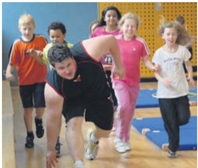
Gemeinsames Aufwärmen: Matthias Steiner dreht mit den Schülern eine Runde durch die Sporthalle.