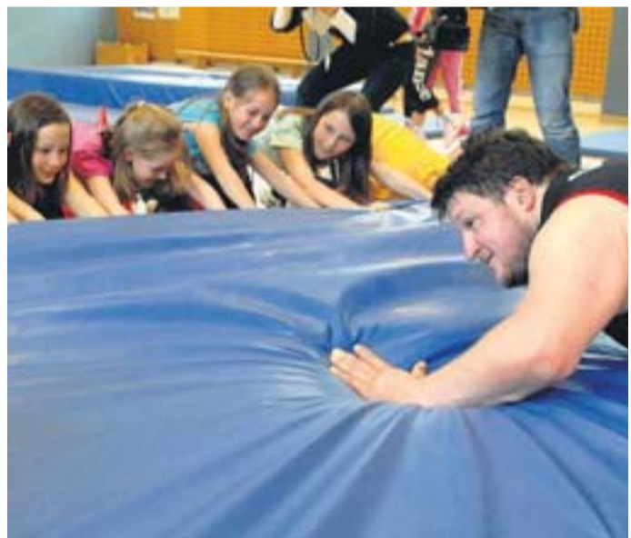
In der Gruppe stark: Zusammen wollen die Dritt- und Viertklässler den stärksten Mann der Welt beim Matten-Schieben bezwingen.